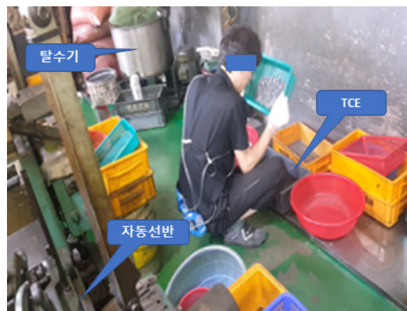
Figure 1. TCE cleaning process

통신용 기계부품을 제조하는 사업장으로 전체 공정은 자동선반과 복합기를 이용하여 가공→세척→도금(외주)→조립→검사를 거쳐 출하공정으로 구성되어 있다. 세척공정은 TCE를 이용한 세척으로 기계가공 근로자 1명이 전담하고 있었고, 세척은 불규칙적인 작업으로 하루에 1회 정도 진행하고 있었다. 세척공정을 세분하여 설명하면 먼저 피세정물을 TCE가 담긴 용기에 5~6회 반복하여 담금 세척 후 탈수기를 이용하여 피세정물에