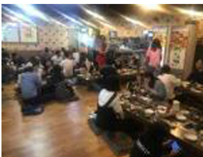
(a) Roasting meat restaurant

SPSS/PC(Statistical package for social science;