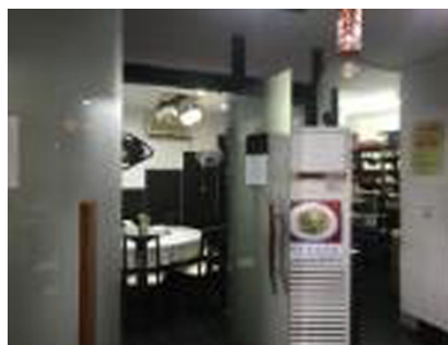
(b) Chinese restaurant