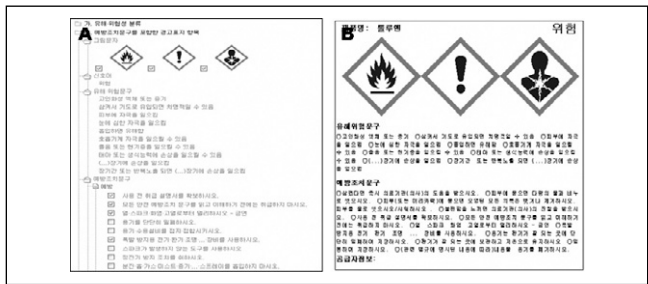
Figure 4. Preparation of labels through MSDS Editing program A : Layout for selecting labelling elements B : The GHS label prepared by MSDS Editing program

대응한 DB 개발을 위해 이전의 DB 체계를 분석한 결과, 이전의 DB 체계는 화학물질 또는 제품 하나에 하나의 파일을 제공하는 문서형 DB로 구축되어 법적 규제정보의 변경, 혼합 제품에 대한 MSDS 수정 등의 최신화 작업과 같은 관리적 차원에서는 비효율적이었으며, GHS 시행초기의 규제정보 등 각종 정보의 변경과 유해·위험성 분류결과 제공, 유해·위험성 분류정보를 이용한 경고표지 작성 기능 등의 추가 서비스를 제공하고, GHS 제도에 대응한 혼합물질의 MSDS를 자동으로 작성하는 기능 등 새롭게 요구되는 서비스에 효율적