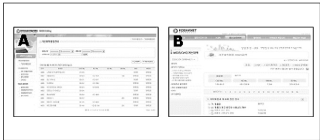
Figure 3. MSDS Editing program on the web A : MSDS DB constructing system in MSDS Editing program B : MSDS DB providing system in MSDS Editing program

대응한 DB 개발을 위해 이전의 DB 체계를 분석한 결과, 이전의 DB 체계는 화학물질 또는 제품 하나에 하나의 파일을 제공하는 문서형 DB로 구축되어 법적 규제정보의 변경, 혼합 제품에 대한 MSDS 수정 등의 최신화 작업과 같은 관리적 차원에서는 비효율적이었으며, GHS 시행초기의 규제정보 등 각종 정보의 변경과 유해·위험성 분류결과 제공, 유해·위험성 분류정보를 이용한 경고표지 작성 기능 등의 추가 서비스를 제공하고, GHS 제도에 대응한 혼합물질의 MSDS를 자동으로 작성하는 기능 등 새롭게 요구되는 서비스에 효율적