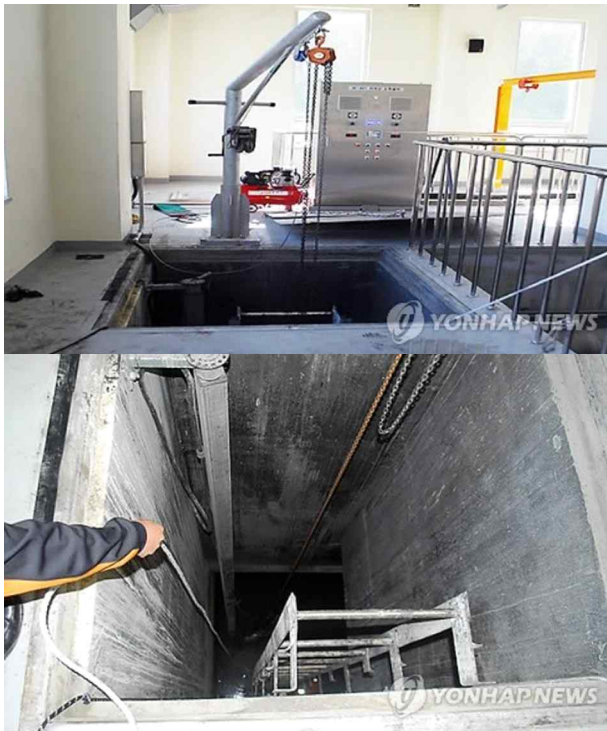
Figure 1. The wastewater treatment tank where a firefighter died in the line of duty (Oct. 30, 2012 in Ulsan, Korea) (Yonhap News photo).

어떤 위치에 있었든 그건 크게 중요하지 않은데, 황화수소가 공기보다 무겁지만 폐수처리조를 폭기하거나 교반하는 경우 수백 ppm 정도의 황화수소가 기류와 함께 일시적으로 밖으로 나올 수도 있기 때문이다(Nogué et al., 2011; Park et al., 2013; NFA, 2017).