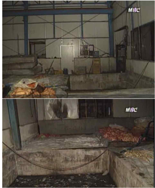
Figure 3. The danmuji(pickled radish) storage pit where 4 workers and a firefighter died by hydrogen sulfide asphyxiation(Nov. 15, 1996 in Sungju, Korea).

순직소방관추모관 순직경위에는 “1997년 11월 15일 오후 4시 27분경 경상북도 성주군 선남면 소재 승보종합식품 단무지 저장탱크 내 쓰러진 작업 인부 4명에 대한 인명구조 활동 중 순직함.”이라고 씌었다 (NFSA, 2019). 김○오 소방사를 포함 5명이 사망한 재해였는데, 당시 보도 중 내용이 상세한 연합뉴스에 따르면 승보종합식품 근로자 6명(사망 4, 부상2), 소방공무원 3명(사망 1, 부상2)이 각각 사상 당했다. 근로자들은 가로와 세로 각 4 m 깊이 3 m 정도의 단무지 저장조에서 양수기로 물을 밖으로 빼내면서 단무지를 소형 리프트